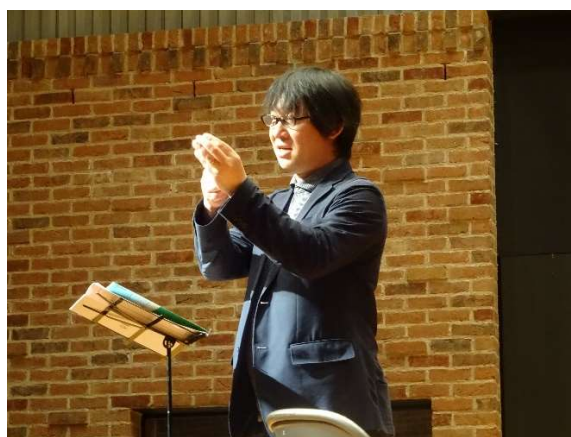
【小久保先生の理論的な説明にも慣れてきたかな？】