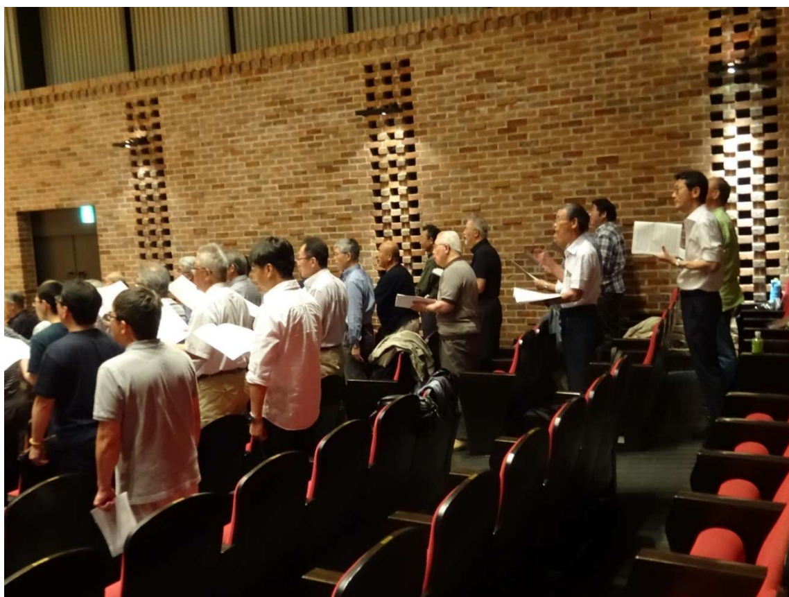
【トップテナー・セカンドテナーの参加メンバーです】