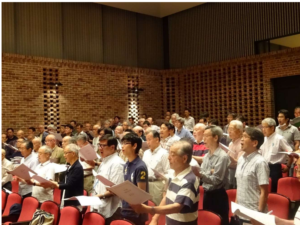
【バリトンの参加メンバーです】