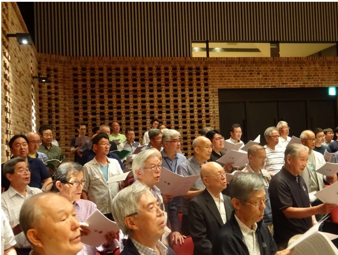
【トップテナーの参加メンバーです】