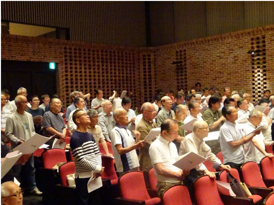
【セカンドテナーの参加メンバーです】