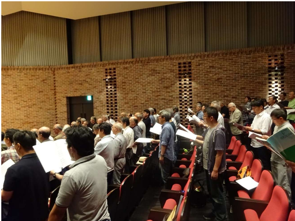
【バリトン・セカンドテナーの参加メンバーです】