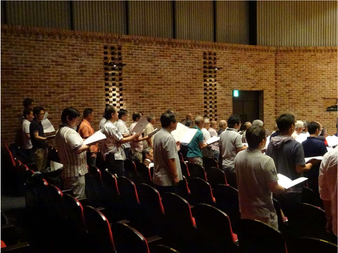
【バリトン・ベースの参加メンバーです】