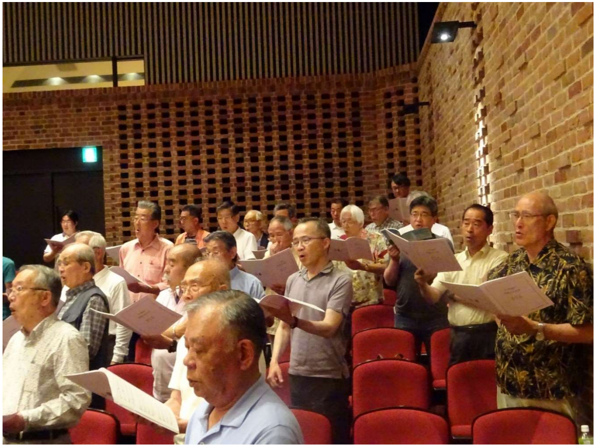
【ベースの参加メンバーです】