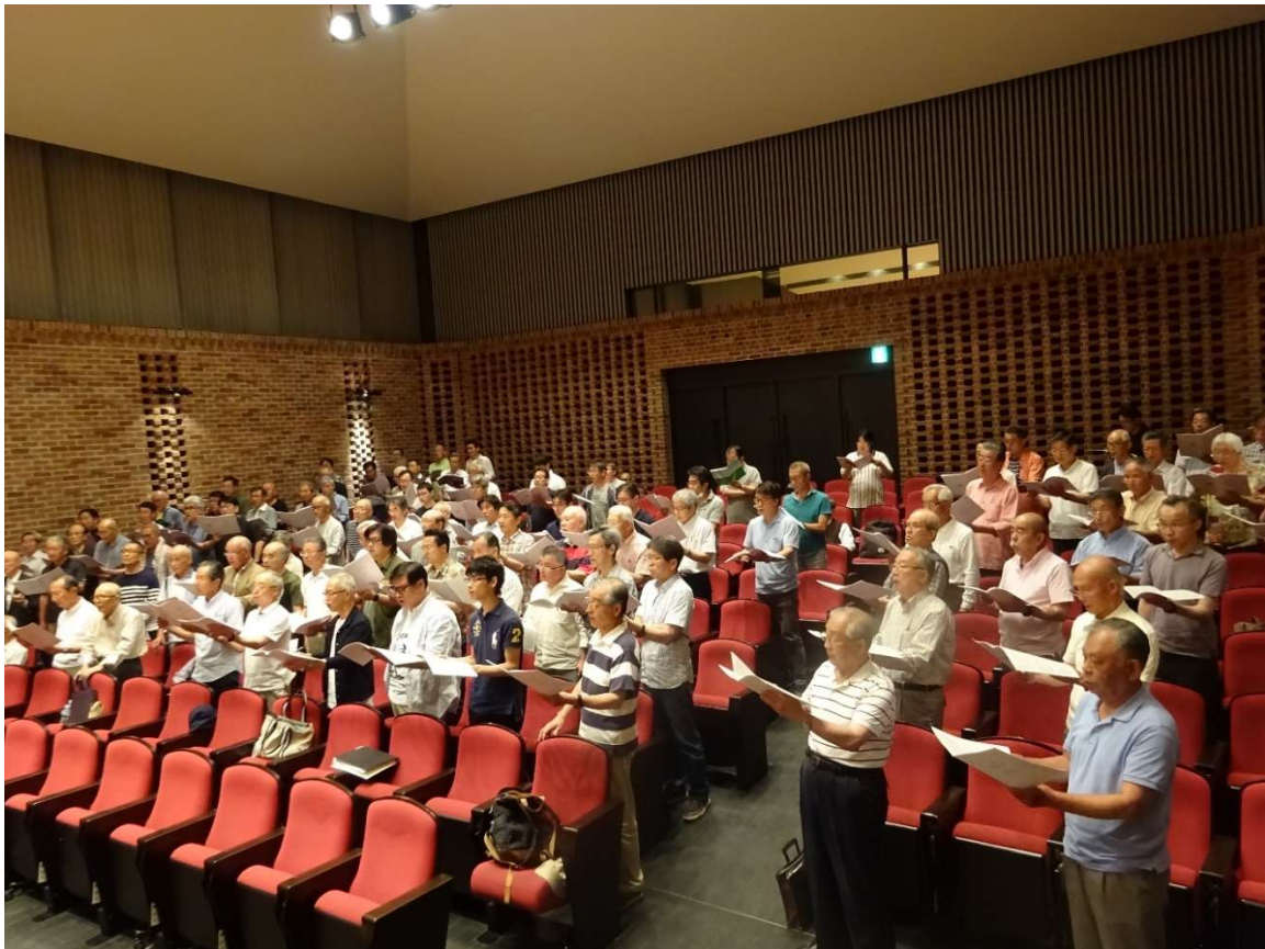
【ベース側から見るとまだまだ席にはあきがあります】