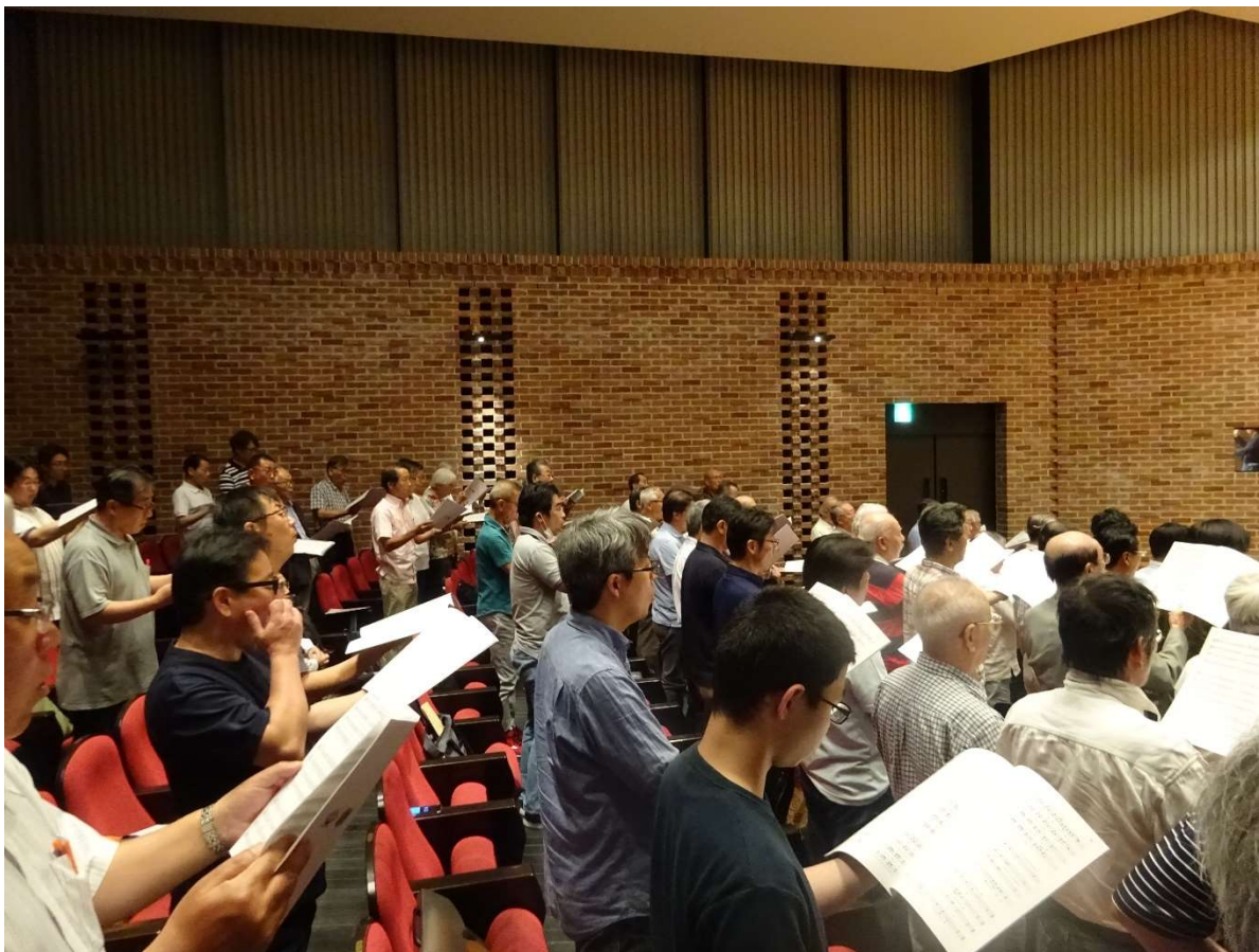
【こちらはセカンドテナーの参加メンバーです】