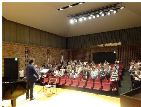
【200 名以上収容のホールの客席を使つての練習です】